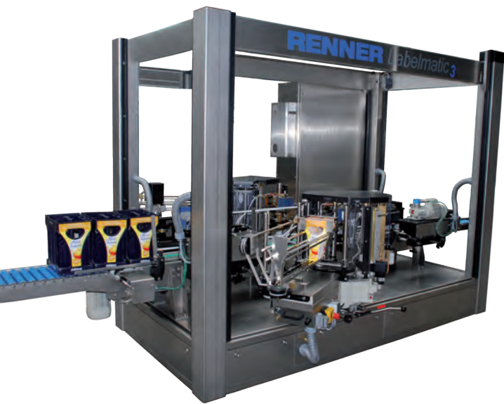
➤ LABELMATIC 3

GETRÄNKEKÄSTEN EFFEKTIV UND FLEXIBEL ALS WERBEFLÄCHE NUTZEN