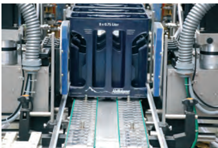
PARALLELE ETIKETTIERUNG DER STIRN- SEITEN