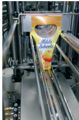
ETIKETTENVORRAT FÜR EINE STUNDE BEI VOLLAST