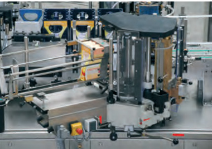
ETIKETTIERSTATION FÜR GROSS- FORMATIGE FOLIENETIKETTEN